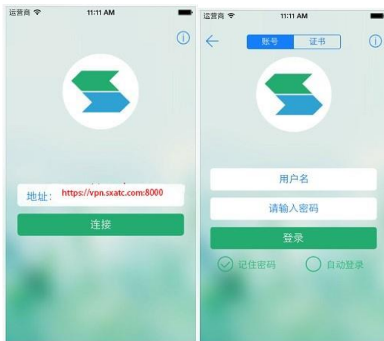
图 4 输入服务器地址