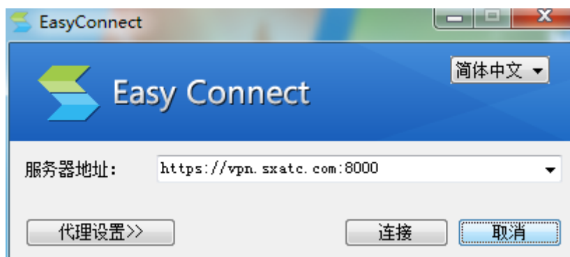
图 2 输入服务器地址

(4) 输入服务器地址： https://vpn.sxatc.com:8000 然后点击“连接”，如图 2。