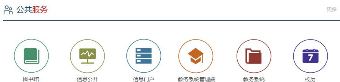
图 6 工科大首页 - 公共服务栏目

1.运行 VPN 客户端 (EasyConnect) 并连接成功后, 电脑端浏览器会自动跳转至“工科大首页”, 在工科大首页下方找到“公共服务”栏目, 如图 6。点击“融合服务门户”、“教务系统”等便可访问校内资源, 也可以直接在浏览器输入地址访问; 后续将陆续增加其他业务系统链接。