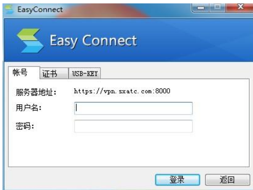
图 3 输入用户名（工科大新工号/学号）和密码（身份证号后 6 位）

(5) 输入用户名（工科大新工号/学号）和密码（身份证号后 6 位）进行登录，如图 3 所示。工科大教职工新工号可以在“支付宝”-“卡包”-“山西工程科技职业大学校园卡”-“电子钱包”中查看（新工号以 2021 开头）。